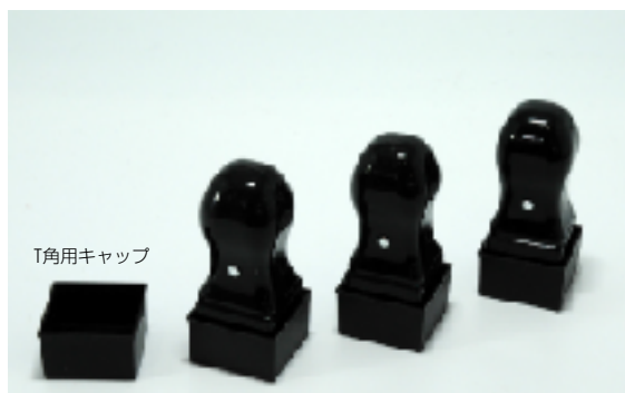
天丸印台T角キャップ付き 2014年7月21日～