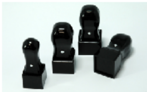
天丸印台T角 2014年7月21日～