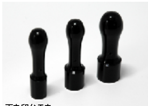
天丸印台T丸 2014年7月21日～