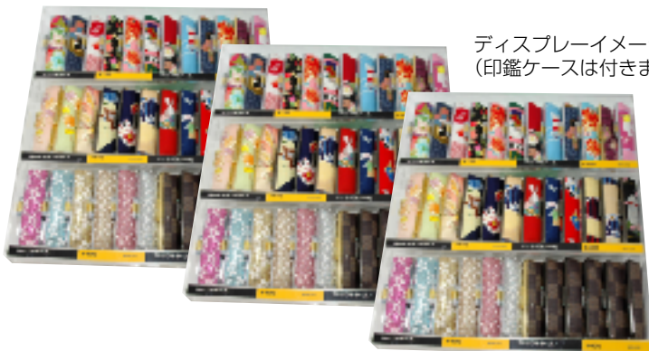
ディスプレイイメージ (印鑑ケースは付きません)