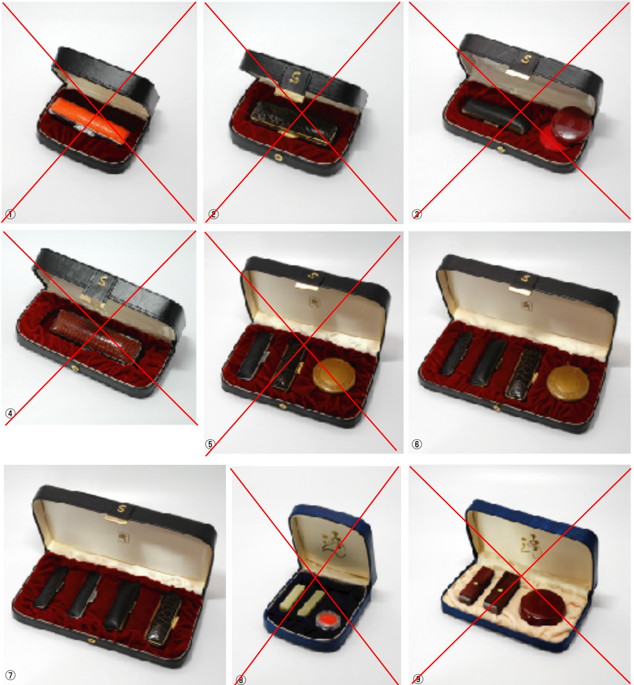
※印材・印鑑ケースは付きません。