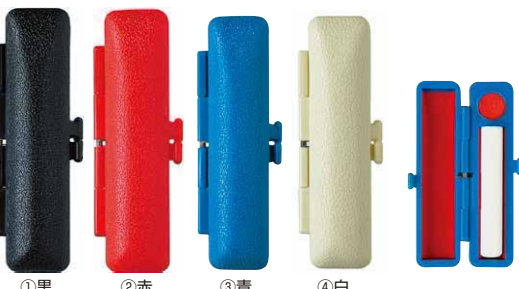
①黒 ②赤 ③青 ④白