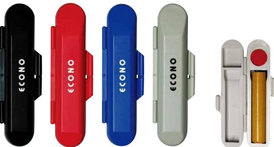
①黒 ②赤 ③青 ④グレー