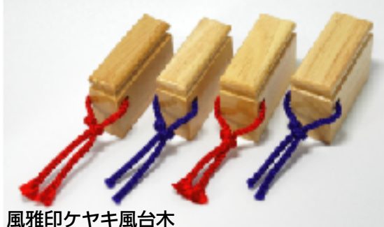
風雅印ケヤキ風台木