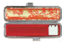
・銀ローケツ ・コーティング ・赤ローケツ ・紺ローケツ ・印伝