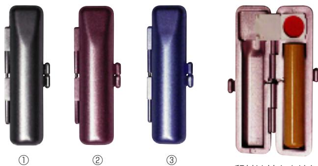
① ② ③