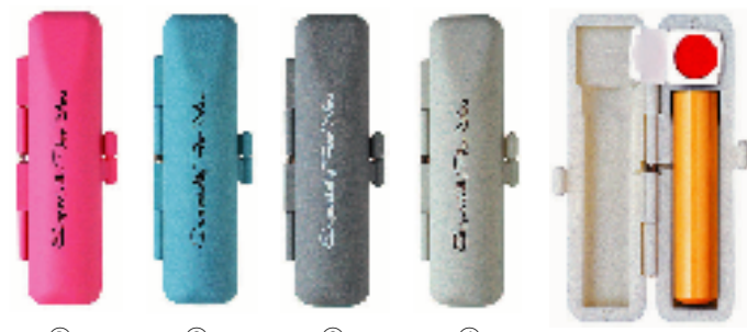
① ② ③ ④