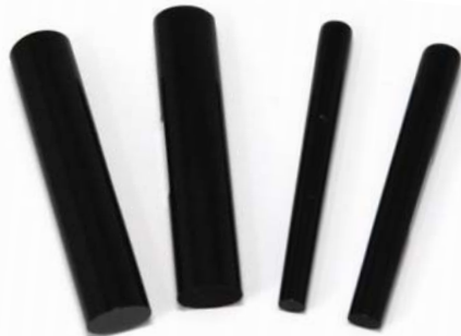
11.4mm(3.8分)小判 12mm(4分)小判 5.4mm(1.8分)小判ボキ 6mm(2分)小判ボキ