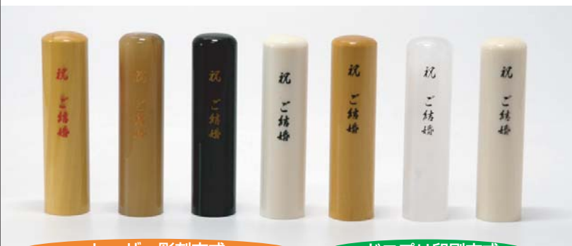
レーザー彫刻方式