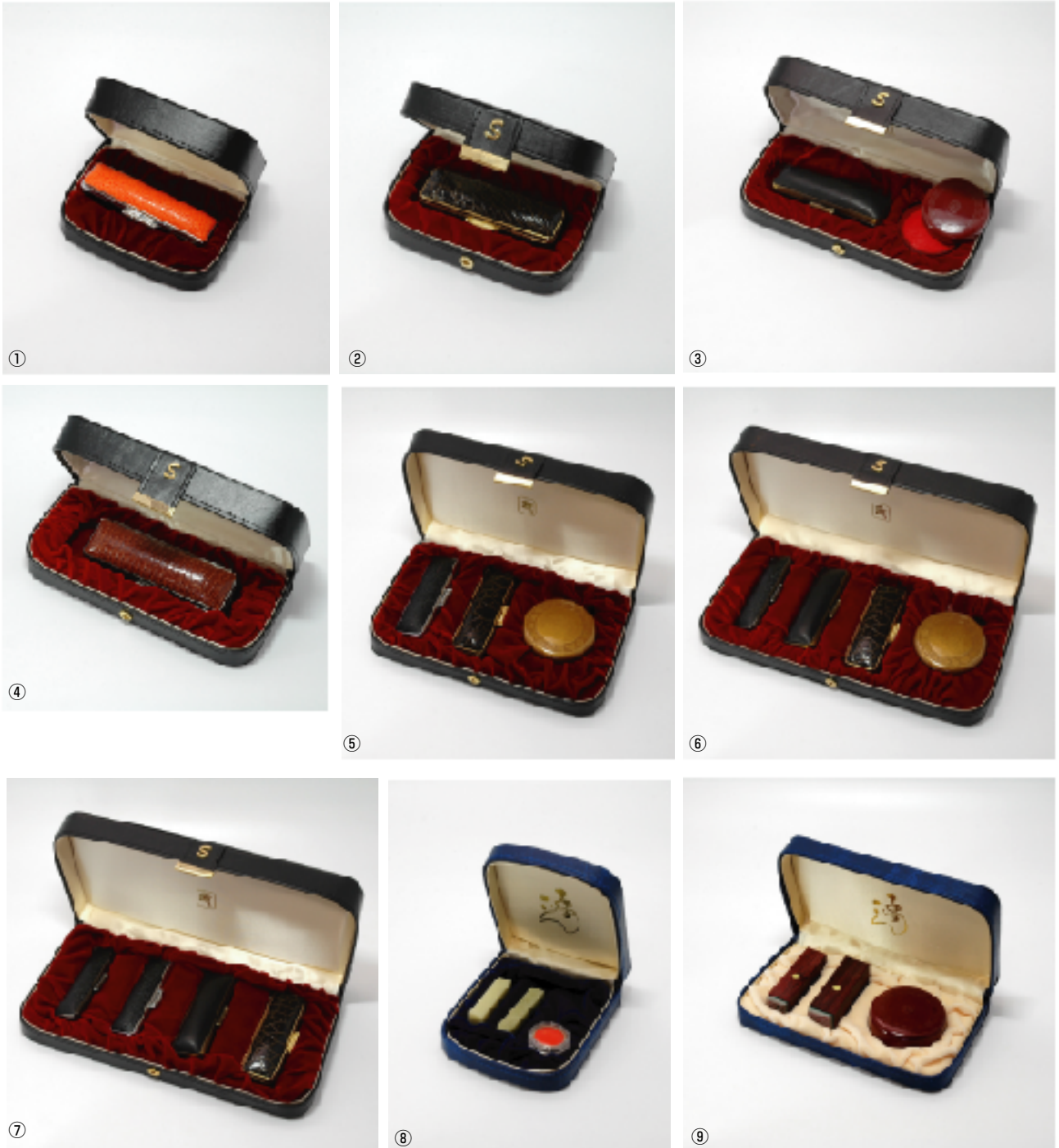
※印材・印鑑ケースは付きません。