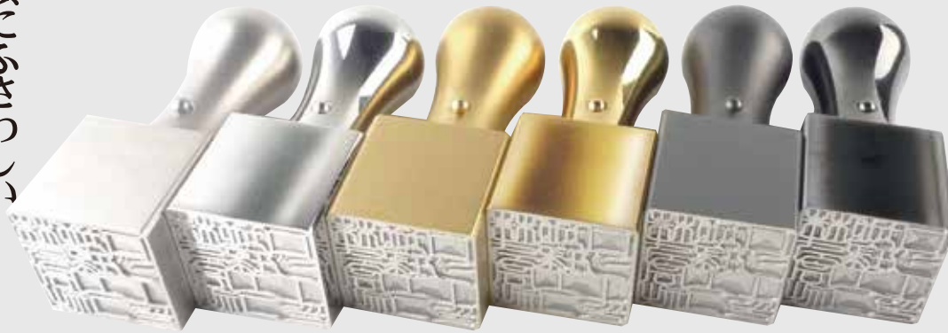
100年チタン (ブラスト加工)