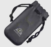
オリジナル皮袋付き