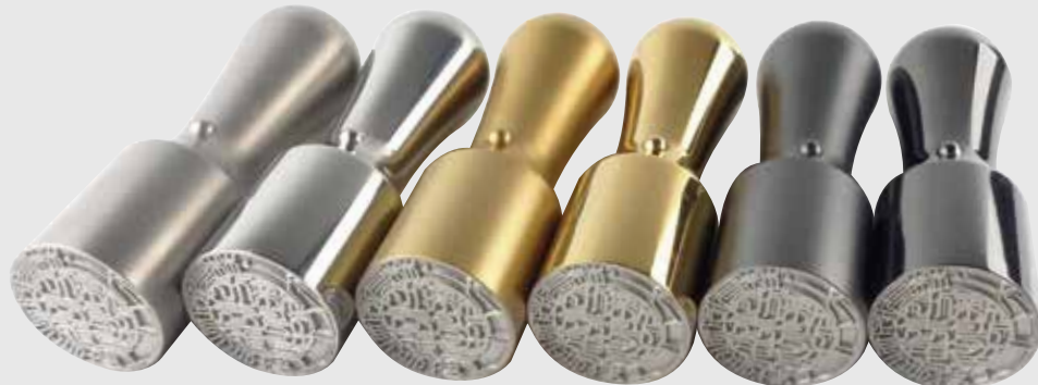
100年チタン (ブラスト加工)