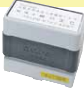
⑧ BR2260 印面サイズ:18×56mm

〒524-0085 大阪府中央区心斎橋筋1-2-3 税理士 橋口正巳 TEL.06-6123-4567