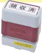
⑥ BR1438 印面サイズ:11×35mm