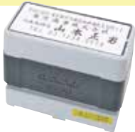
⑨ BR2770 印面サイズ:23×66mm