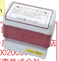
⑩ BR3458 印面サイズ:30×54mm

■お振込先は下記 振込銀行名:判子屋商事株式会社 口座番号:普通10020000000000000000 会社名:判子屋商事株式会社 毎度有難うございます。