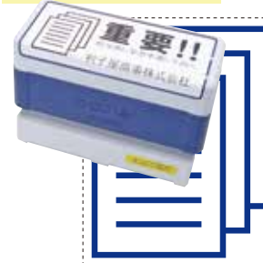
⑪ BR4090 印面サイズ:36×85mm

〒524-0085 大阪府中央区心斎橋筋1-2-3 税理士 橋口正巳 TEL.06-6123-4567